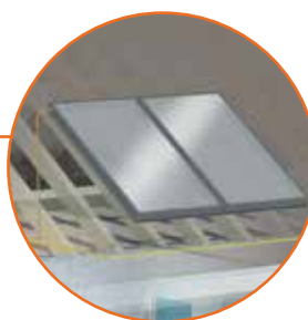
Solar Térmico com Tecnologia Drain-back